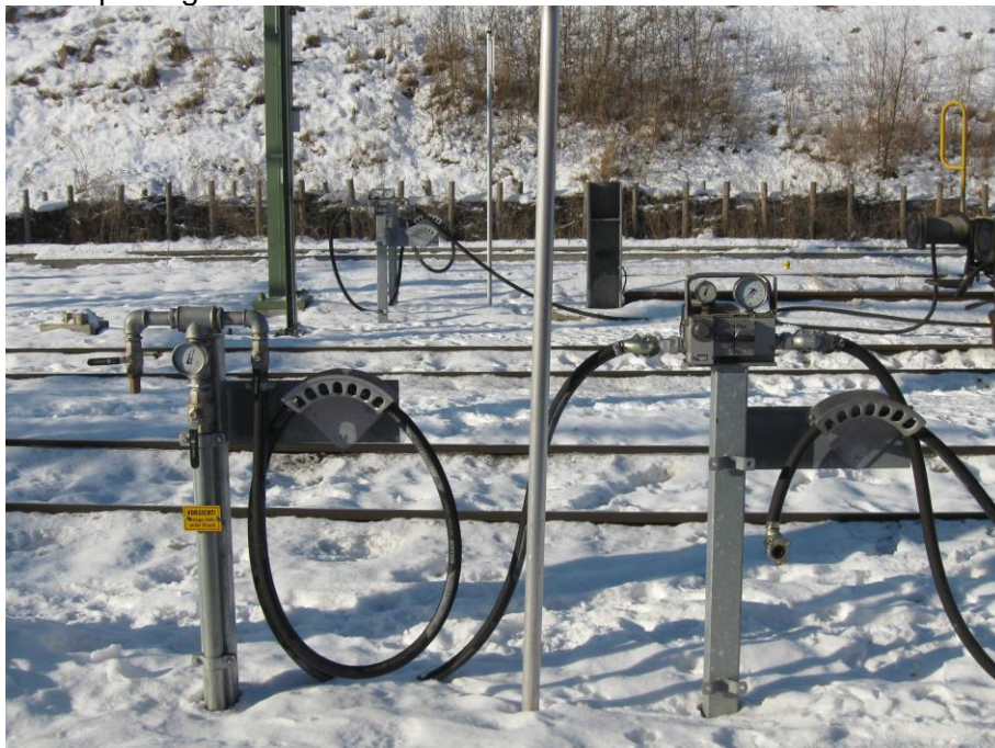
Bremsprobegerät PDR1-N KV-Terminal